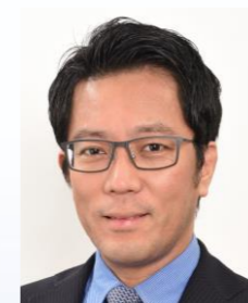
原文 堅 (がん研究会有明病院)