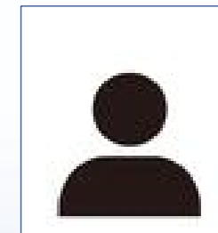
沖 英次 (九州大学)