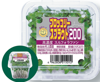
かいわれタイプ ブロッコリースプラウト200