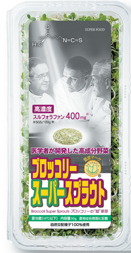
もやしタイプ ブロッコリースーパースプラウト