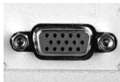
※ MiniD-sub 15ピン

④会場で用意するPCケーブルコネクタの形状はMiniD-sub 15ピンです。この形状に合ったPCをご用意いただくか、この形状に変換するコネクタをご用意ください。特に、Macintoshは必ず付属の変換コネクタをご持参ください。