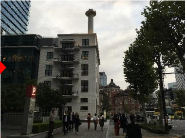
写真⑥:左手前方にJPタワー(KITTE)が見えたら、左折

東京国際フォーラムの地上広場に左手にA棟(写真①)、右手にG棟(写真②)の見える位置(マップ内星印の位置)に立ちます。