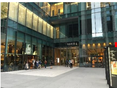
写真⑦:右手奥のJPタワー(KITTE)入口より建物内へ

エレベータを降りますと、左手に会場のJPタワーホール&カンファレンス(写真⑨)がございます。