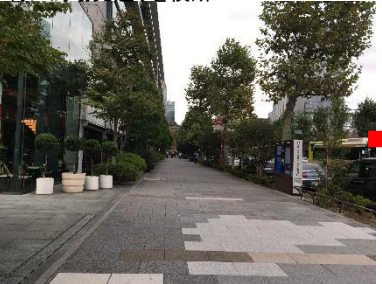
写真⑤:左手に東京ビルTOKIAを見ながら、200メートルほど直進