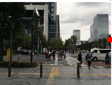
写真③:東京国際フォーラムを背に馬場先通りを横断