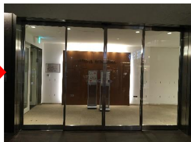
写真⑨:エレベータを降り、左手にJPタワーホール&カンファレンス会場へ