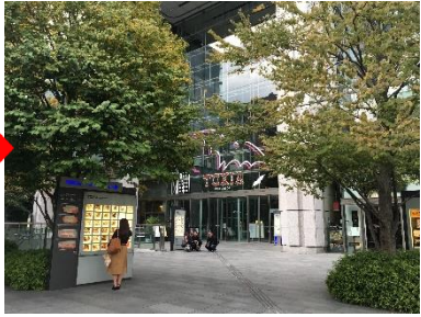
写真④:馬場先通りを横断後、左手に見える東京ビルTOKIA